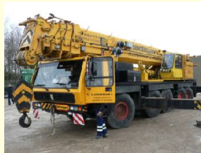
Crane Inspection Mevas